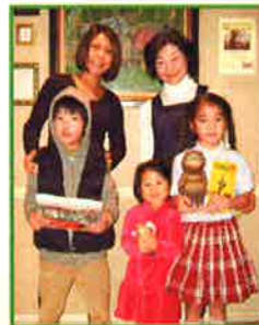
※ろうどくの森教室にて