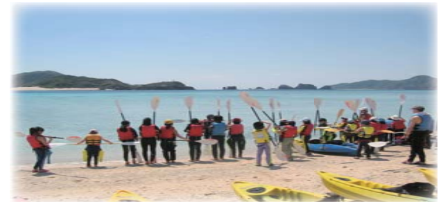
沖縄・座間味島でのESP