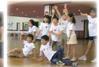
イングリッシュサマープログラム