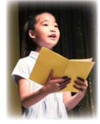
ろうどくの森（銀座博品館）に出演