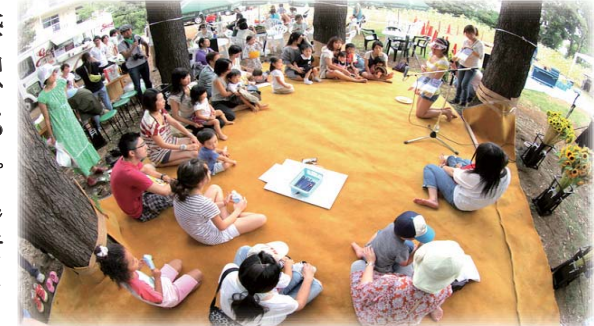
代官山ひまわりプロジェクト 読み聞かせとワークショップ